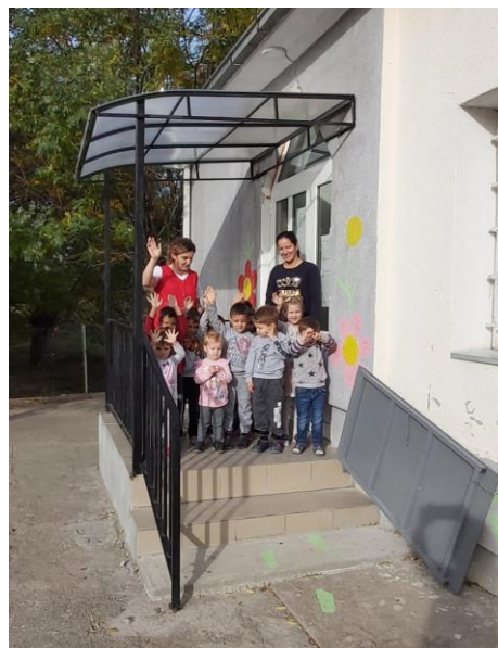
Објект „Пчелки,, село Тремник