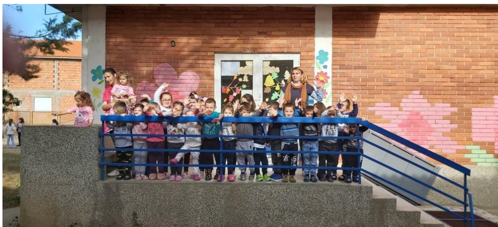
Објект-„Свончиња,, село Криволак