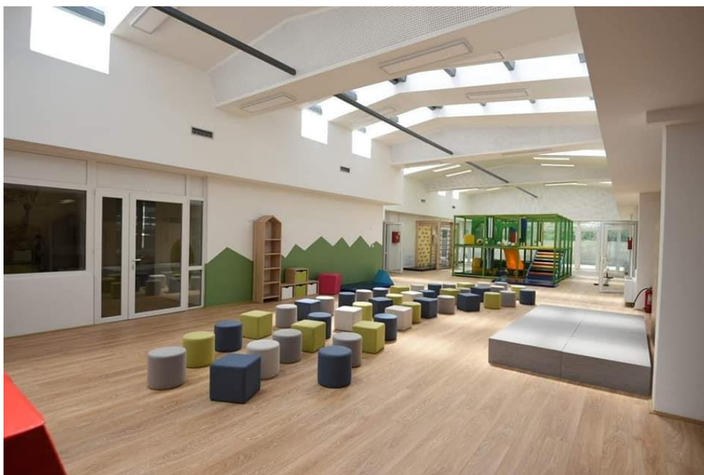
Објект „ Темјанушка “ ул: „ Станко Франц Пипан “ бб – Неготино mail : temjanuska21@yahoo.com