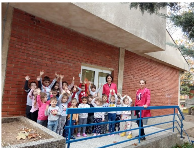
Објект „ Зајачиња “ село Пепелиште